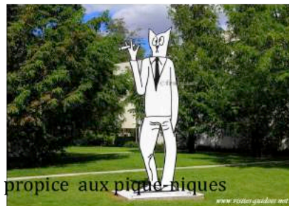
Parc du musée propice aux pique-niques

Possible dans le restaurant du MAC/VAL ou alentours